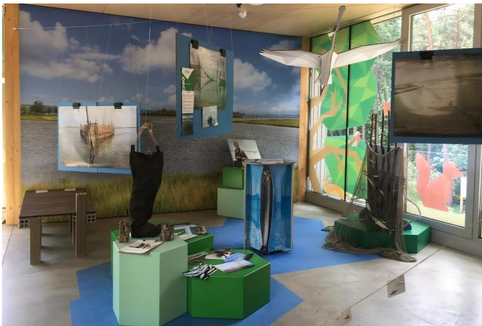
De tentoonstelling over de weervisserij bij Natuurpodium Brabantse Wal.

Van juni tot oktober heeft er bij Natuurpodium Brabantse Wal in Bergen op Zoom een mooie tentoonstelling gestaan over de weervisserij. Volgens het Natuurpodium is de tentoonstelling goed bezocht. Als gevolg van de coronasituatie zochten veel mensen (met kinderen) vertier in de directe omgeving en heeft het Natuurpodium daarvan geprofiteerd. Er waren een paar honderd flyers beschikbaar en deze bleken bij het afbreken allemaal op.