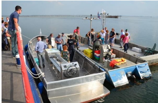
De vletten liggen te wachten op passagiers van Marjoes. In de verte wacht een weer op de bezoekers.

Eind 2019 is er aan de hand van de getijdentabel een rooster gemaakt voor bijliggen en voor gunstige tijden voor vaartochten. Er is een selectie gemaakt voor schooltochten en voor de open tochten. Dit overzicht is naar firma Van Dort gegaan ter verificatie. Tijden waar bijliggen nodig is worden ook vastgesteld. Het schema voor de vaartochten is naar Hendrik Hoogerwerf gegaan voor planning van het passagierschip Marjoes .